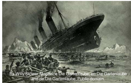
By Willy Stöwer, Magazine Die Gartenlaube, en:Die Gartenlaube and de:Die Gartenlaube, Public domain.